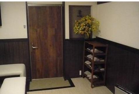
☆トラック内部玄関