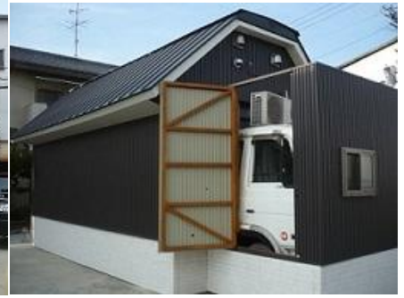
☆運転席へ乗車する為の扉。 私有地内であれば、 多少の移動もこれでOK！！