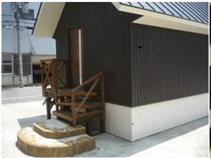
☆荷台後ろウッドデッキを 付けておしゃれな雰囲気に