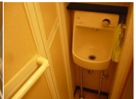
☆コンパクト手洗器