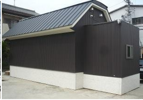
☆トラック全体を外壁で 覆いまるで一軒家のような 仕上がりに！！