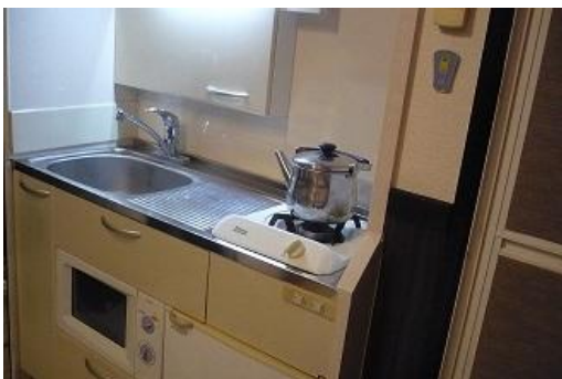
☆ミニキッチン 冷蔵庫・レンジも付けてみました!(^^)!