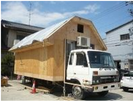
☆トラック荷台部分の 改装工事写真